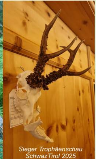
Sieger Trophäenschau Schwarz Tirol 2025